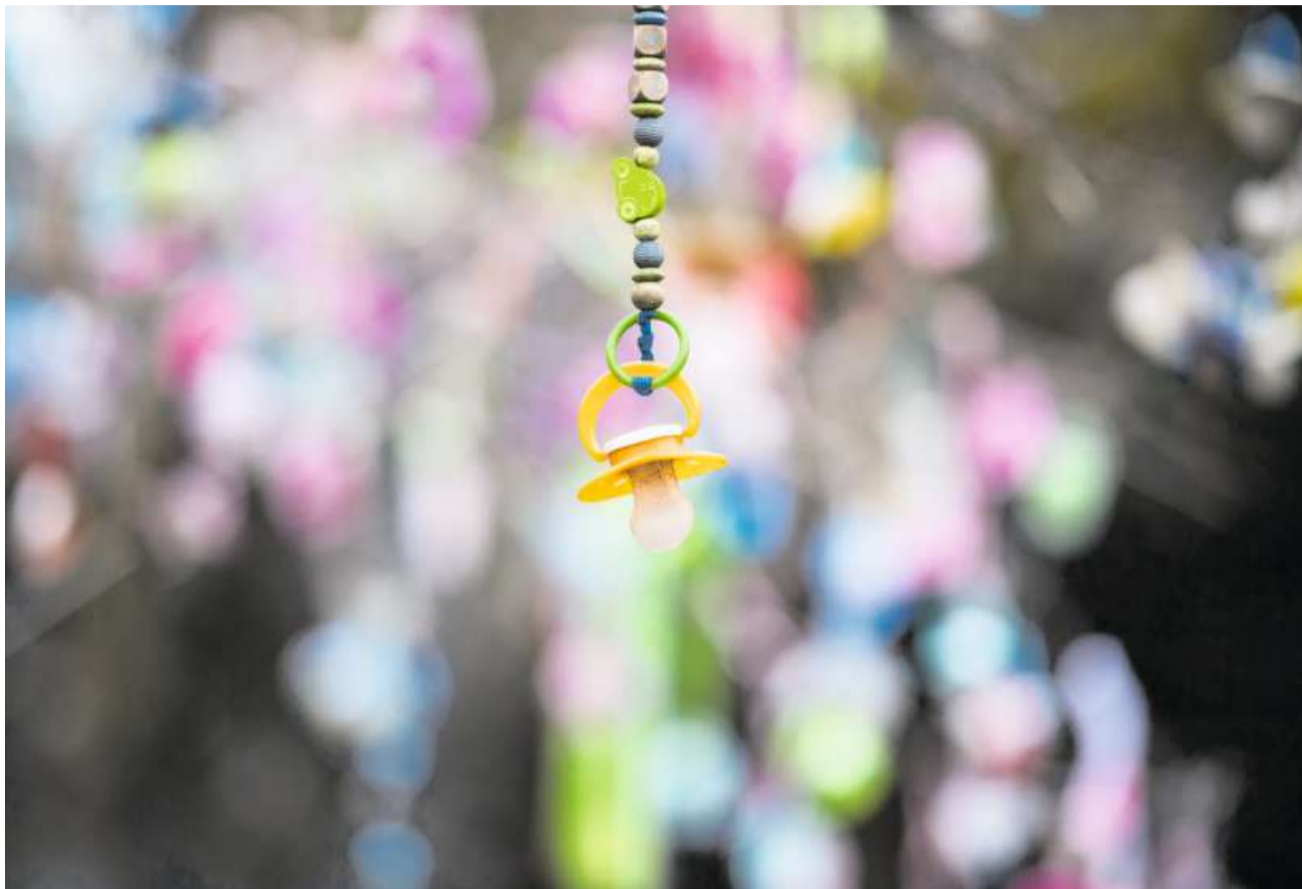
Die Demografie ist unerbittlich: Werden heute zu wenige Kinder geboren, fehlen in zwanzig Jahren Arbeitskräfte.

Der Umbau geht aber noch tiefer, ins Herz jeder Arbeitsbeziehung: direkt auf den Lohn. Im Personalbereich verdienen alle neuen Mitarbeiter im Squad-Team dasselbe Basisalar. Von der Erfolgsbeteiligung – bei der GKB wird ein fixer Teil des Gewinns an die Mitarbeiterinnen ausgeschüttet – verteilt Villiger die Hälfte, die