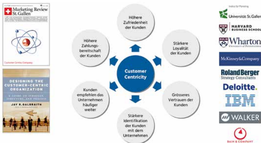
Abb. 1: Erfolgswirkung der Customer Centricity

Alle Zusammenhänge wurden in wissenschaftlichen Studien empirisch nachgewiesen.