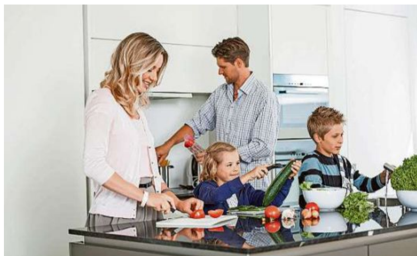
Eine professionelle Beratung schützt hinterbliebene Konkubinatspartner in verschiedenen Situationen vor unliebsamen Überraschungen.

Für Konkubinatspaare ohne gegenseitige finanzielle Abhängigkeit ist dieser Umstand von untergeordneter Bedeutung. Ganz anders verhält es sich jedoch,