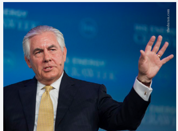
Rex Tillerson, U.S. Aussenminister, zur Kommunikation innerhalb der aktuellen US-Regierung.