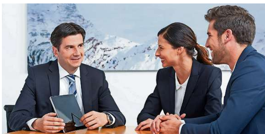
Investitionen in die Entwicklung von Führungskräften zahlen sich aus. Regelmässig durchgeführte Befragungen der Mitarbeitenden bestätigen den Erfolg.

Die Wirkung des Kulturentwicklungsprogramms kann verstärkt werden, indem parallel zu den Impulsen auf der Führungsebene, auch Impulse auf der Mit-